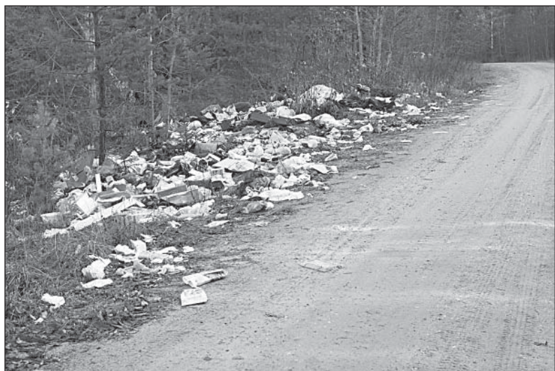
Помойку на обочине дороги устроили самые ленивые жители.