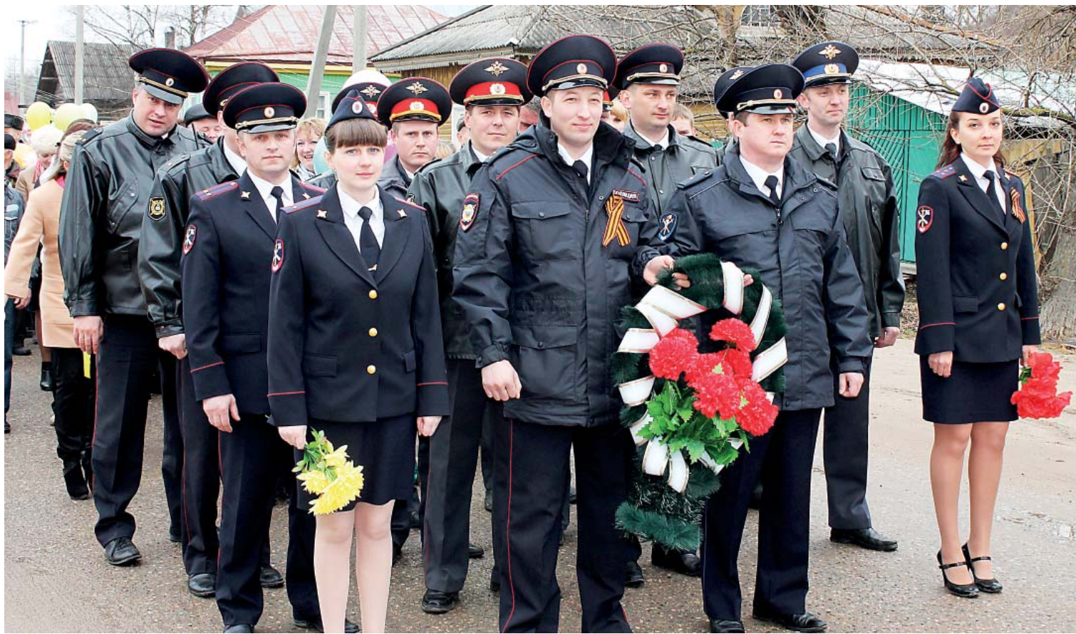
Сотрудники МО МВД России «Верховажский» на митинге в честь Дня Победы 9 мая 2014 года.