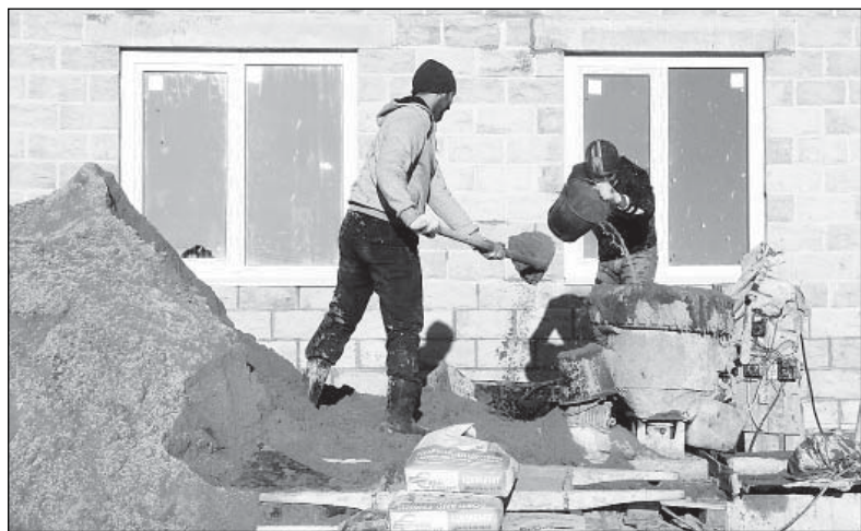
Идет штукатурка фасада здания.

Проект редакции при поддержке Управления информационной политики правительства Вологодской области