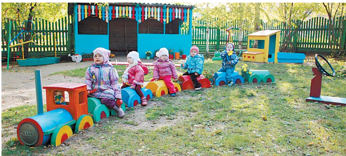
Предметно-развивающая среда в д/с №2 «Солнышко» создана таким образом, что воспитанники могут заниматься и вместе, и по одному. Есть уголки с необходимыми играми и для мальчиков, и для девочек.