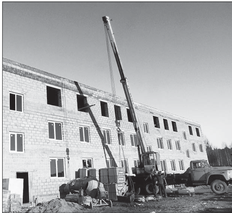
Обещают, что через месяц дом будет под крышей.