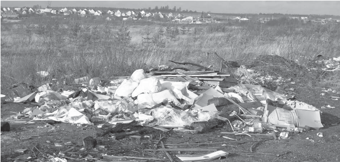
Одна из многочисленных куч мусора на берегу Ваги портит вид на деревню Сомицыно.